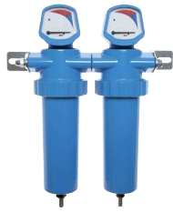
Anwendungsbeispiel: 2 Gehäuse